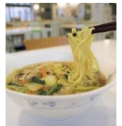
毎週水曜は 麺の日です 今日は 五日ラーメン