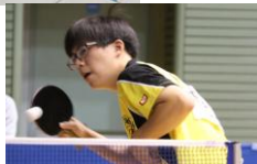
(上) 生活体験発表宮城県大会 (左) 卓球部全国大会