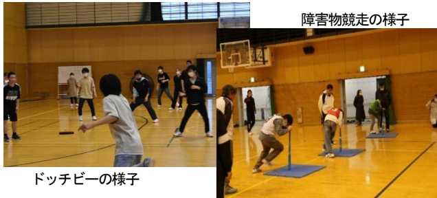
ドッチビーの様子

本校では年に2回のスポーツ大会を実施しています。生徒会を中心に競技種目を検討し、学年を解体してチームを編成します。過去にはドッチボール、ドッチビー、障害物競争、ペタンクなどが実施されました。スポーツを通して親睦を図り、楽しい時間を過ごします。