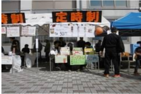
古工展 中庭 定時制ブースでの販売風景

電気研究部・機械研究部の活動報告や、生徒会による学校紹介展示。中庭、定時制のブースでは、生徒会、各学年の模擬店でお客様をお迎えしています。焼き芋・やきとり・チョコバナナ、うどんやカレーなど毎年工夫を凝らしたメニューを販売しています。ぜひ一緒に楽しみましょう。