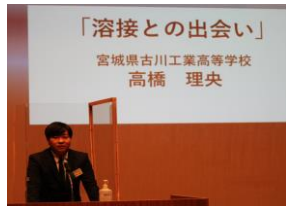
(上) 生活体験発表宮城県大会 (左) 卓球部全国大会