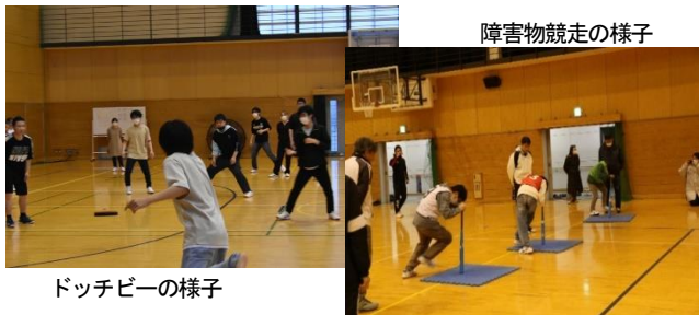
ドッチビーの様子

本校では年に2回のスポーツ大会を実施しています。生徒会を中心に競技種目を検討し、学年を解体してチームを編成します。令和5年度は、ドッチビーと障害物競走を実施しました。スポーツを通して親睦を図り、楽しい時間を過ごします。