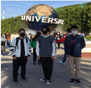
3学年 自主研修日 USJ

本校では3年生の11月に修学旅行を実施しています。どこに行くかはその学年に任されていますが、関西方面が主流です。令和4年度は、前年延期になった4年生も実施だったため、ふた学年がそれぞれ京都・大阪などを満喫してきました。