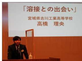
(上) 生活体験発表宮城県大会 (左) 卓球部全国大会