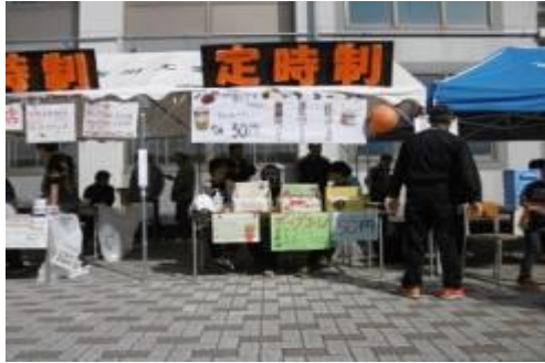
古工展 中庭 定時制ブースでの販売風景 R1

電気研究部・機械研究部の活動報告や、生徒会による学校紹介展示。中庭、定時制のブースでは、生徒会、各学年の模擬店でお客様をお迎えしています。焼き芋・やきとり・チョコバナナ、うどんやカレーなど毎年工夫を凝らしたメニューを販売しています。ぜひ一緒に楽しみましょう。