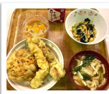
<天井・里芋のみそ汁> かつお節