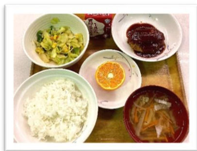
チーズインハンバーグ

1月19日（月）日から23日（金）にかけて、第3回食育週間を実施しました。今回のテーマは「食育クイズ&リクエスト献立」です。クイズでは、れんこんや大豆といった身近な食材をはじめ、冬至や鏡餅の由来などの行事食が出題され、食への関心を高める良い機会となりました。また、給食アンケートで生徒から寄せられた「リクエスト献立」も登場。人気のメニューばかりとあって、生徒たちはいつも以上に楽しそうに給食を味わっていました。